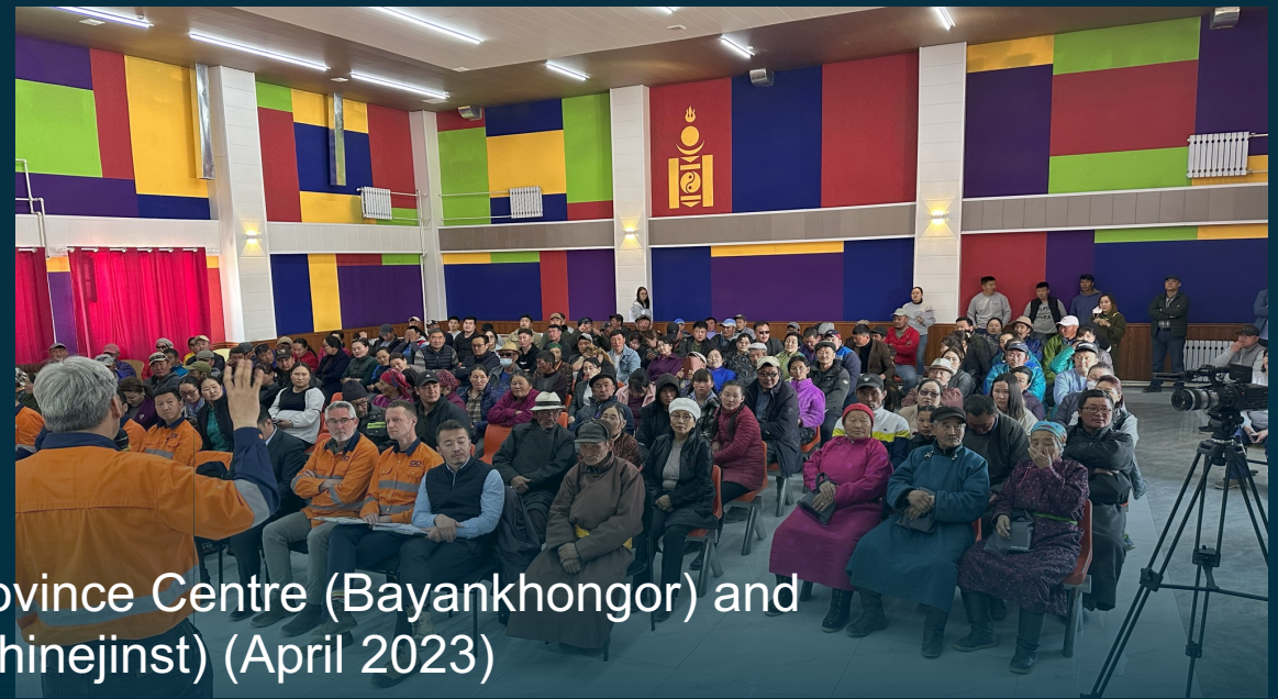
MMC & ERD CEO's Opening Representative Office in Province Centre (Bayankhongor) and Hosting an Open House Event in Sub-Province Centre (Shinejinst) (April 2023)