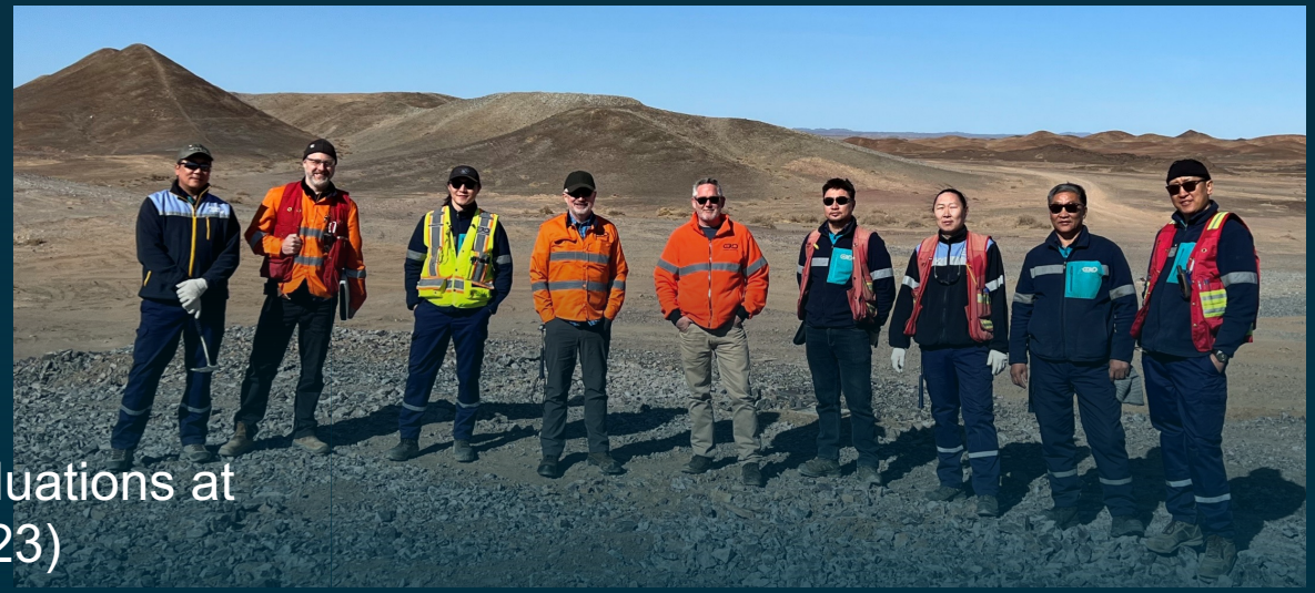
ERD Discovery Team Geologists Conduct Field Evaluations at Bayan Khundii, Dark Horse and Zuun Mod (April 2023)